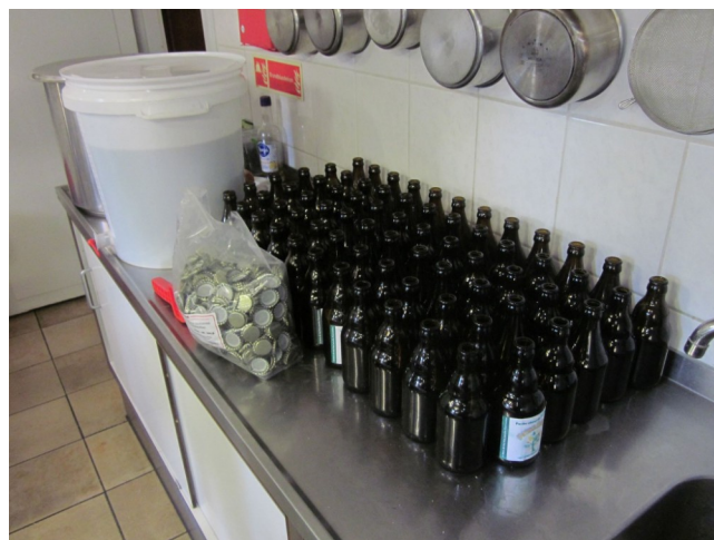
En la bildo: kreado de etoso

La kvara Klaĉ-Kunveno Post-Somera estis, kompreneble, denove granda sukceso. 81 homoj kuniĝis en bela vilao en Heerlen por kune lerni, klaĉi kaj etosumi. Multaj aĝgrupoj, nacioj kaj lingvoniveloj ĉeestis, kaj en la fino malfacilis la aŭdiaŭado.