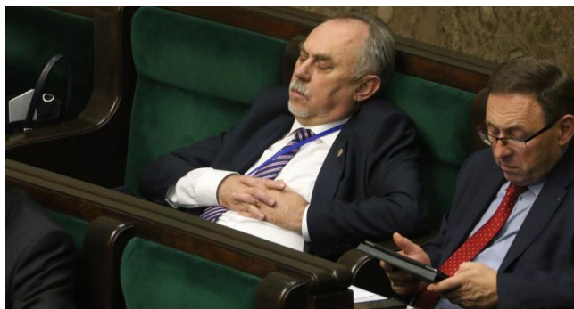
Politikistoj nun eĉ dormas en la parlamento

Sed en alia organizo tia agado estas nenio nova. En TEJO ekde jardekoj regas kutimo preni ĉiujn gravajn decidojn post la noktomezo. Statutŝanĝoj, laborplanoj kaj elektado de prezidanto preskaŭ neniam okazas dum kutimaj laborhoroj. "Alie nefestemuloj povus influi nian internan politikon", avertas komitatano kun bierbotelo en la mano.