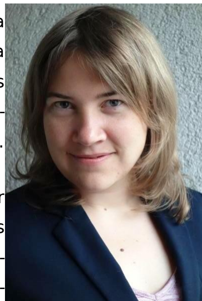
Denove membro de TEJO

Nun la Verdaj Skoltoj ankaŭ volas altigi sian aĝlimon por havi pli grandan membraron. NEJ dum KKPS pridiskutos la temon, kaj aliaj landaj sekcioj de TEJO ankaŭ konsideras ĉu sekvi la decidon. Estas eĉ indikoj, ke UEA pripensas aldoni kelkajn jarojn al la membreco. Tiam tamen la asocio bezonos ankaŭ enkonduki sistemon por voĉdonigi la postvivajn membrojn.