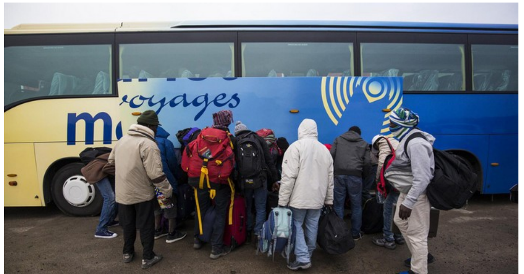
La aliĝintoj bedaŭre ne iros al Bath

En Calais dum la pasinta semajno estis malplenigita kaj malkonstruita grandega tendaro de homoj, kiuj volis pluvojaĝi per la Manika Tunelo al Britujo. Laŭ demandado de nia ĵurnalisto surloke, A. Tendo, plejparto el ili havas invitleterojn por la JEB-renkontiĝo en Bath, kiu okazos post du semajnoj. Kiel kutime la Brita registaro decidis ne doni ajnajn vizojn, sed la ĉi-jara grupo estis tre persista kaj ek-tendumis antaŭ la tuneleniro.