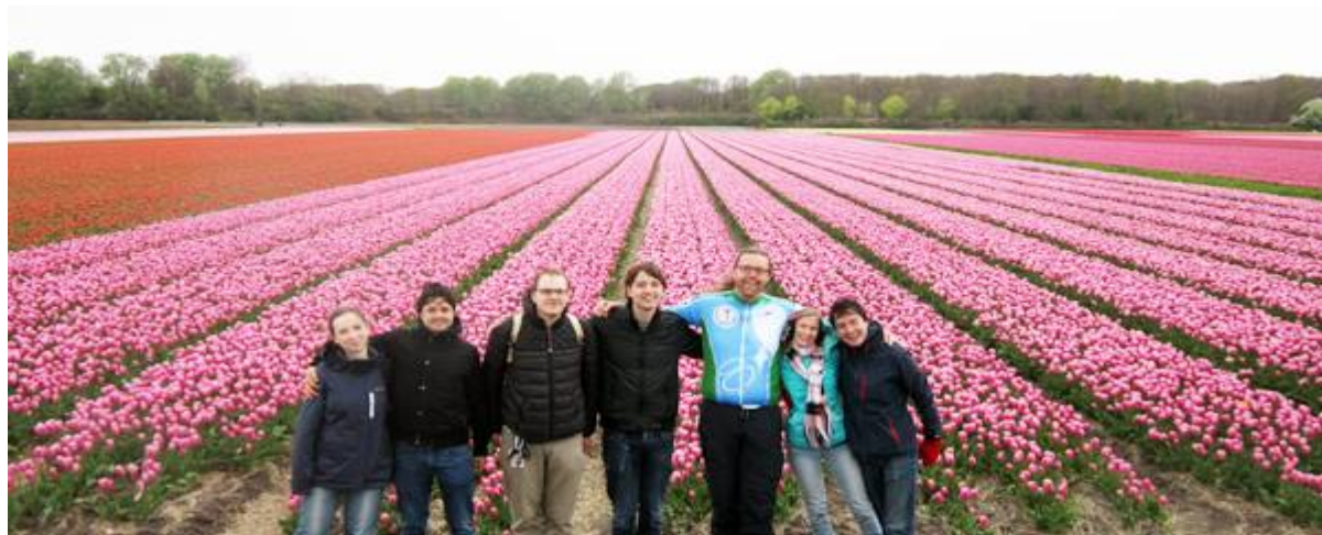
Membroj de NEJ antaŭ florplena kampo