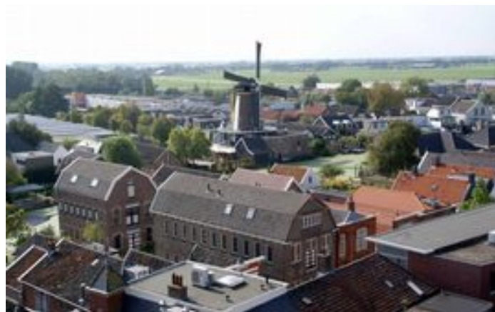
Ĉu tio ĉi estas Bodegraven?

Ĉi-jare ni trovis eĉ pli malinteresan lokon ol pasintjare por organizi eĉ pli mojosan semajnfino: Bodegraven . Laŭ diversaj konspiraj teorioj la urbeto ne ekzistas. Malgraŭ tio la loko troviĝas en bela verda kamparo inter laĝetoj kaj riveretoj.