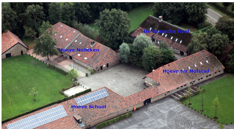
Kie dormos vi?

La unika junulargastejo De Hoof ofertas 248 litojn, grandan amasloĝejon kun profesia kuirejo kaj grandan kampon por tendumantoj. Ĝia unika trinkejo estas perfekte izolita por festi ĝis la nokto-, noktofino.