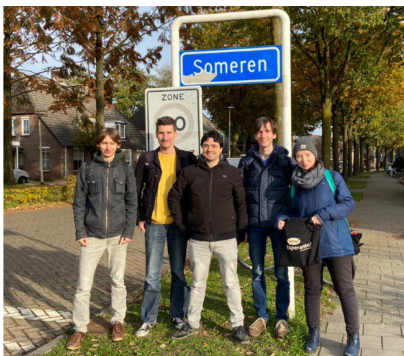
Mankas en tiu ĉi bildo: vi