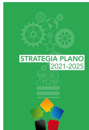
Jen la plano

Post preskaŭ kvar jaroj da sufero sen ajna strategio la estraro de UEA finfine prezentis dum la Virtuala Kongreso sian novan strategian planon por 2021-2025. La plano estas tre ampleksa kaj prezentita en bela dokumento, tamen la enhavo foje ŝajnas ne plene rilati al UEA.