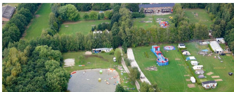
Imagu jam viajn tagojn en kaj apud tiu lago

Igu https://ijk2022.tejo.org/ jam vian komencaĝon, parkerigu ĝian enhavon kaj mense pretiĝu por sabato la 30-a de oktobro je 21:30 , kiam finfine malfermiĝos la aliĝilo por IJK 2022!